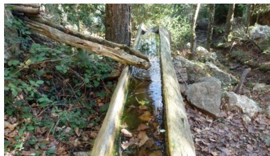
Font del Paradís.